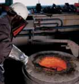
Homogenisieren des Schmelzmaterials.

Auch in der Produktionsabteilung ist nur das Beste gut genug. Ihr Scheidgut wird in einem Vakuuminduktionsofen geschmolzen, was eine höchstmögliche Reinheit garantiert. Durch Hinzufügen von Flussmittel werden Metalle während des Schmelzprozesses von Unreinheiten und Abfällen getrennt. Nach dem Erhitzen erfolgt das Ausgießen in große und kleine Barren. Homogene Barren aus Mischmetall (edle und unedle Bestandteile) sind das Ergebnis.