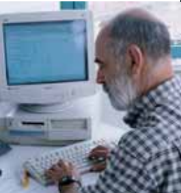
Ergebniseingabe ins EDV-System.

Die Zusammensetzung der Proben wird mittels Fotospektromanalyse definiert, die Ergebnisse werden ins EDV-System eingegeben und an Sie mit einer Gutschrift weitergegeben.