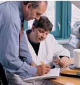
Ermittlung des Scheidgut-umfangs.