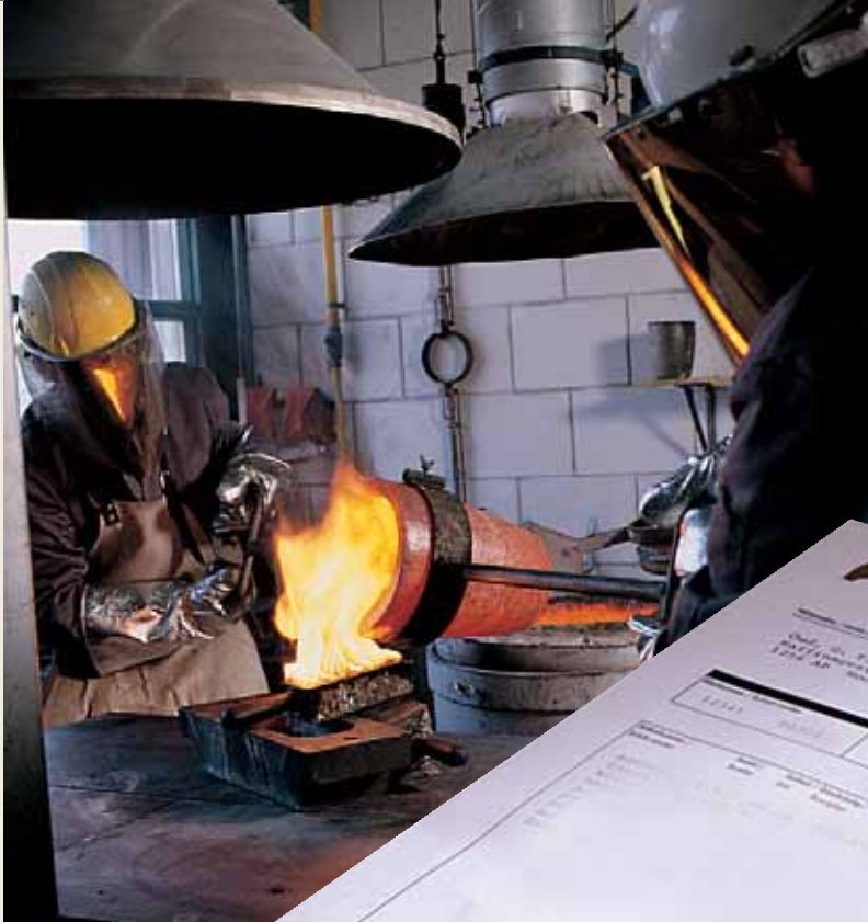
Ausgießen des Schmelzmaterials.