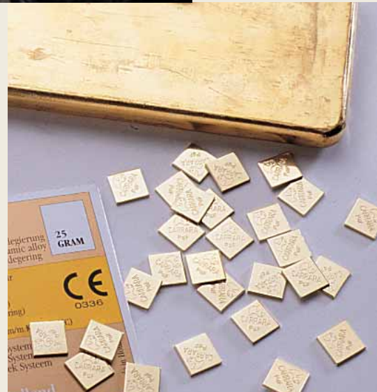
Recycling von wertvollen Materialien.

Das Scheiden von Edelmetallen gehört zu unseren Kernkompetenzen. Ihr Scheidgut ist bei uns in sicheren Händen. Wir garantieren für die sichere Aufarbeitung Ihres Scheidguts.