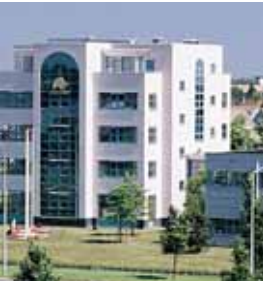
Elephant Dental, Hoorn.