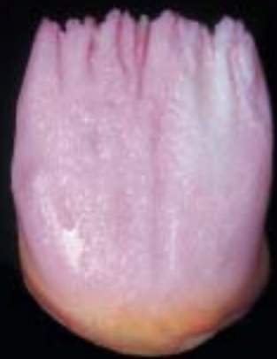
3 dentin dopo l'asportazione (cutback)

Schema Antagon Interaction per una struttura a strati personalizzata