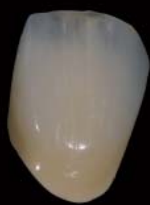
9 Corona lucida finita