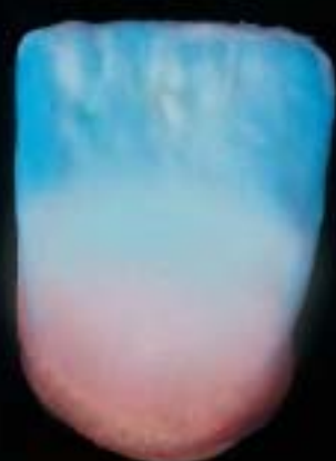
8 Applicazione completa con incisal