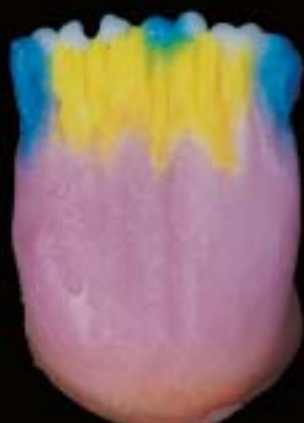
5 Applicazione della massa x-tra incisals