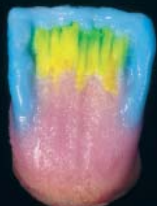
6 Applicazione della massa incisal