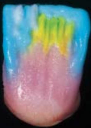
7 Struttura incisale a "sandwich"