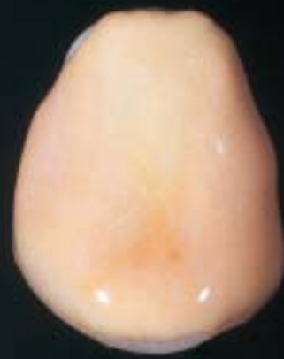
2 Applicazione della opaque dentin