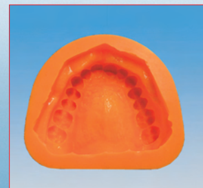
Voor snelheidsmaniakken Silflex Orange Speed!