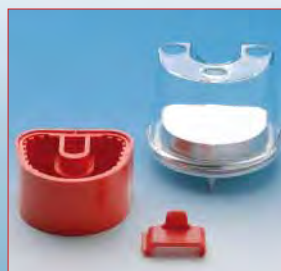
Cuvette de duplication pour silicone et gel.