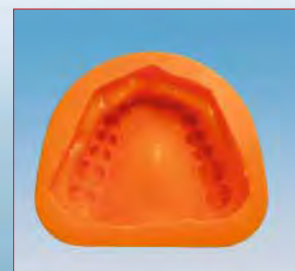
Et pour les passionnés de la vitesse : Silflex Orange Speed !