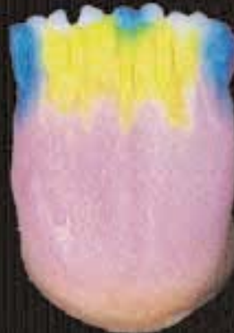
5 Aanbrengen van verschillende x-tra incisals