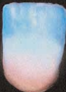
8 Volledig opgebouwd met incisal