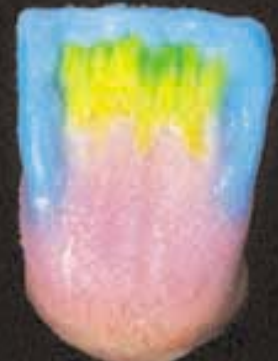
6 Omlijsting met incisal