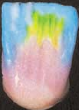
7 Incisale "sandwich"-opbouw