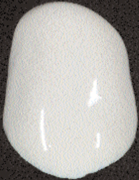
1 Aangebracht paste opaque