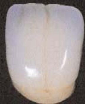
9 Voltooid, geglanze kroon