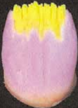
4 Aangebracht action i-dentin