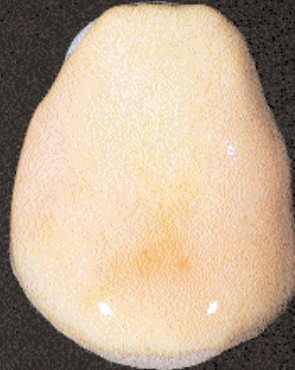
2 Aanbrengen van opaque dentin