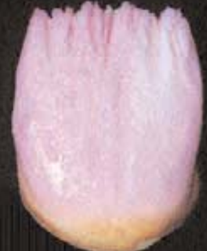
3 Gereduceerd dentin (cutback)