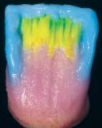
6 Applicazione della massa incisal