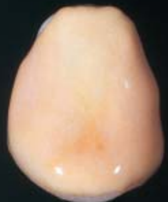
2 Applicazione della opaque dentin