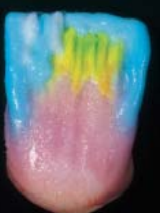
7 Struttura incisale a "sandwich"