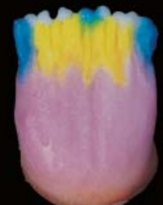
5 Applicazione della massa x-tra incisals