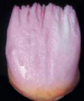
3 dentin dopo l'asportazione (cutback)

Schema Antagon Interaction per una struttura a strati personalizzata