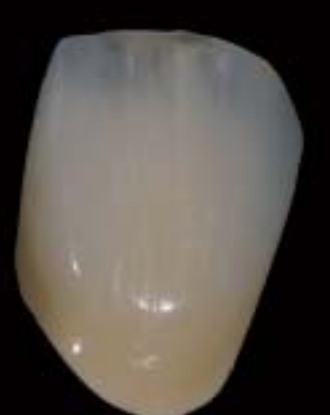
9 Corona lucida finita