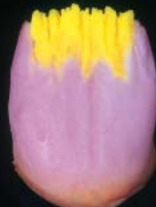
4 action i-dentin applicata

Schema Antagon Interaction per una struttura a strati personalizzata