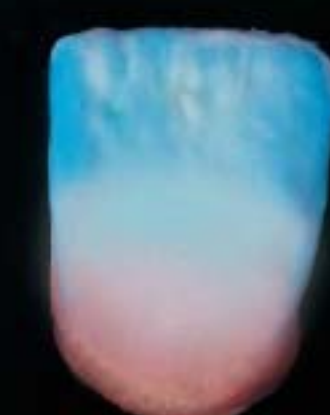
8 Applicazione completa con incisal