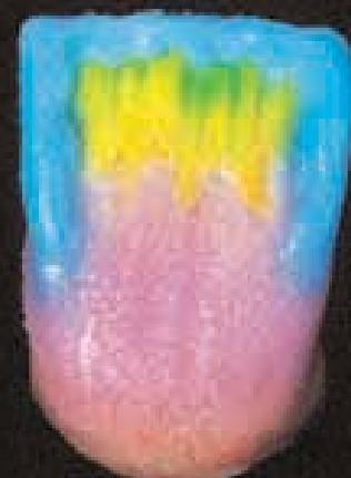
6 Application de l' incisal