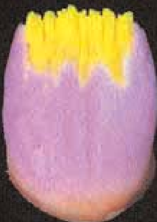
4 Action i-dentin insérée

Construction individuelle par couches d'Antagon Interaction sur alliage à fusion normale