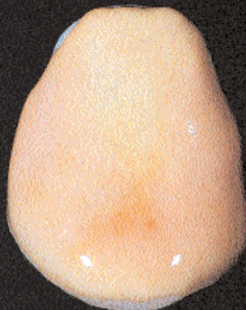
2 Application de l'opaque dentin