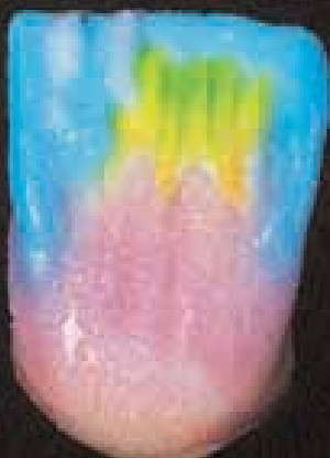
7 Couches incisales alternées