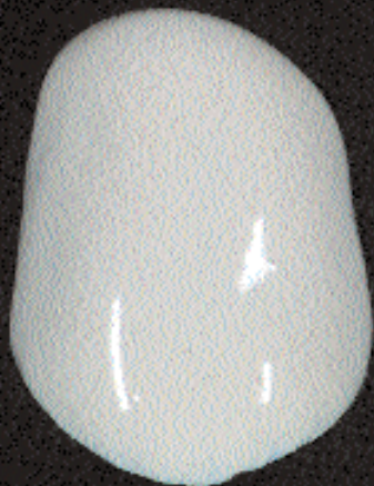
1 Pâte opaque appliquée