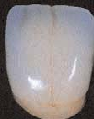
9 Couronne achevée, glaçage effectué