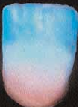
8 Finition avec incisal