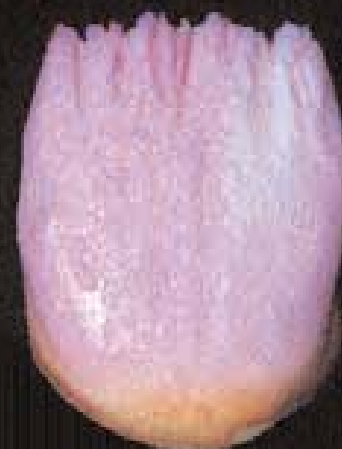
3 Dentin réduite (cutback)

Construction individuelle par couches d'Antagon Interaction sur alliage à fusion normale