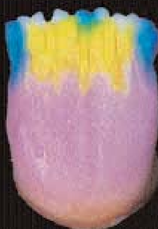
5 Application des différentes x-tra incisals