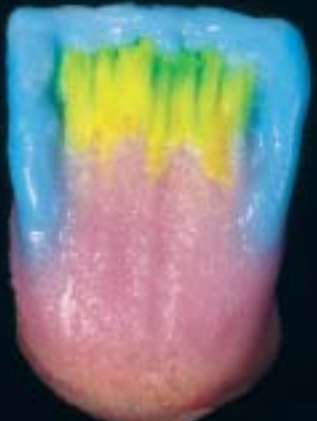
6 Kenarların incisal kaplanması