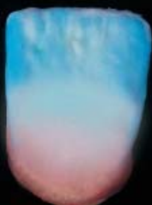
8 Incisal ile tamamen kaplama