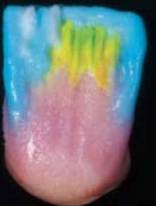
7 Sandwich teknik kullanılarak, insizal ile tabakalama