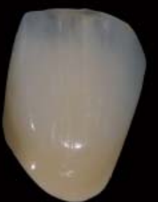
9 Bitirilmiş, glazürü yapılmış kron