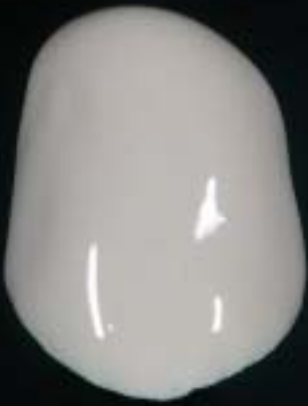
1 paste opaque uygulaması