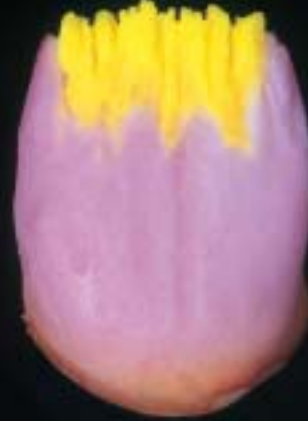
4 action i-dentin (flüoresan insizal dentin) uygulaması

Standart derecede eriyen alaşım üzerinde Antagon Interaction'ın kişisel tabakalaması