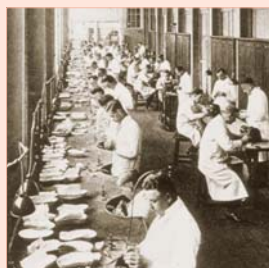
Il laboratorio Vitallium ® nel 1932

Già nel 1932 la lega Vitallium ® venne patentata come un metallo dalle ottime proprietà biocompatibili, infatti venne impiegato in diverse applicazioni come ad esempio la fabbricazione di protesi chirurgiche per le articolazioni del gomito e dell'anca.