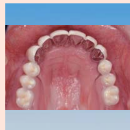
Protesi mobile (mascella) nella cavità orale