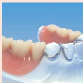
Protesi parziale (mandibola) sul modello in gesso