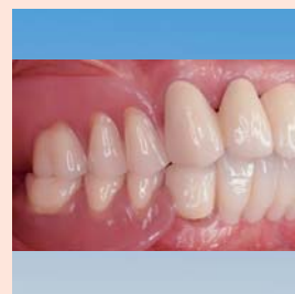
Protesi combinata (mascella e mandibola) nella cavità orale