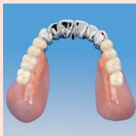
Protesi mobile (mascella)

Il sistema è composto da prodotti dentali di successo, oggetto di un'esperienza clinica maturata in decenni di protesi dentali amovibili.